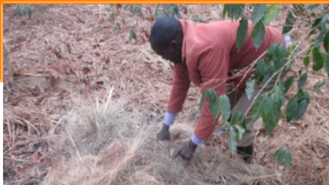
9月下旬に迎える雨季に向けてマルチで土を守る

ルワンダでは、乾季から少しずつ雨季に季節が変わり始め、雨が降ることも多くなってきました。ちなみにルワンダの降水量は平均して年1,000mm程度。その雨季の始まりに備えてコーヒー農家さん達は、雨による土壌浸食を防ぐ為に マルチで土を守ったり 、来年の収穫を改善する為に 土壌pHや畑の状態から施肥計画を立てたり 等、収穫が終わっても大忙しで作業を続けています。来年の収穫が今からまたとても楽しみです。