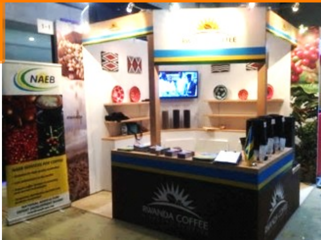
昨年SCAJ2015のルワンダブース

2016年9月28日(水)から30日(金)に東京ビッグサイト開催される、アジア最大のスペシャルティコーヒーイベント『SCAJ (Specialty Coffee Association of Japan)2016』に昨年に引き続きルワンダもブースとセミナーで参加します！ルワンダ人コーヒーオーナー達がブースで皆様のご来場をお待ちしております！ブースでは直接コーヒー関係者の方の商談はもちろん、「ルワンダの人とちょっと話してみたい」「ルワンダコーヒーってどんな味なんだろう」という一般客の方も大歓迎です。数種類のフリーテイस्टングやビデオによるルワンダ紹介などコンテンツも豊富です。普段あまり飲んだ事が無いと思われる方には、ルワンダコーヒーを体験して頂けるととても良い機会になるはずですよ。